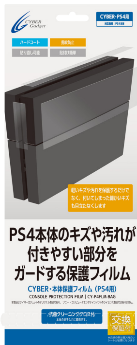
CYBER・本体保護フィルム (PS4用)