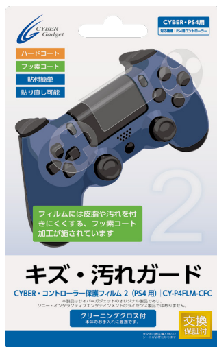
CYBER・コントローラー保護フィルム2 (PS4用)