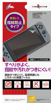
CYBER・液晶保護フィルム [指紋防止タイプ] (SWITCH用)