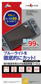
CYBER・液晶保護フィルム [ブルーライトハイカットタイプ] (SWITCH用)