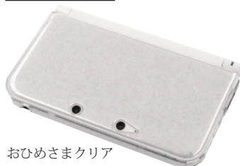
おひめさまクリア