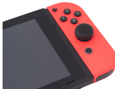
ノーマルタイプ装着時