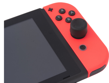
ハイタイプ装着時