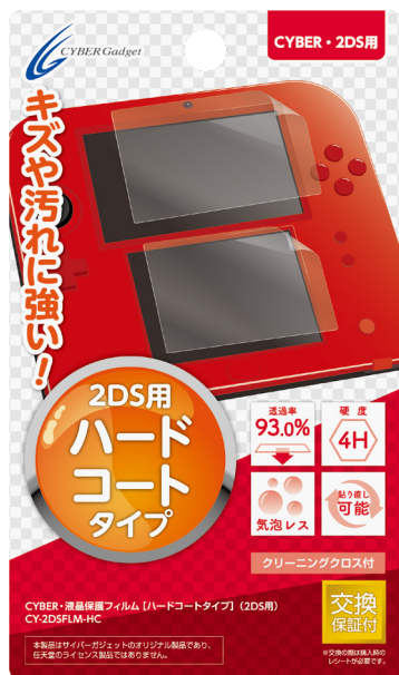
CYBER・液晶保護フィルム 【ハードコートタイプ】(2DS用)