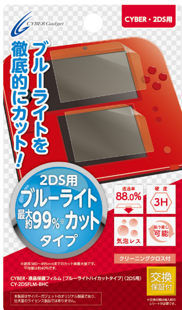
CYBER・液晶保護フィルム 【ブルーライトハイカットタイプ】(2DS用)