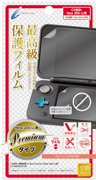
CYBER・液晶保護フィルム Premium (New 2DS LL用)