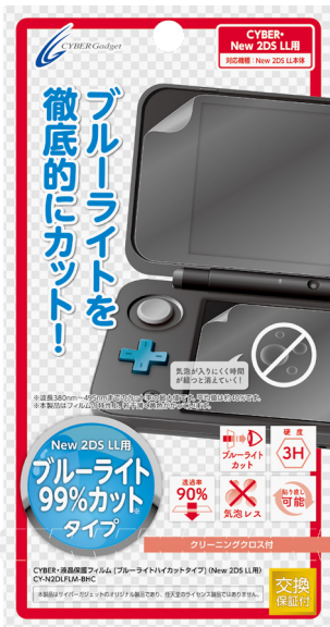
CYBER・液晶保護フィルム [ブルーライトハイカットタイプ] (New 2DS LL用)