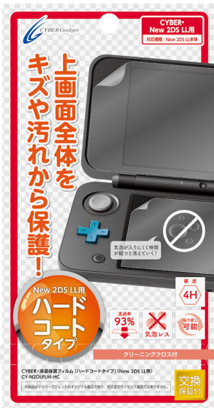
CYBER・液晶保護フィルム [ハードコートタイプ] (New 2DS LL用)