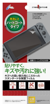
CYBER・液晶保護フィルム [ハードコートタイプ] (SWITCH用)