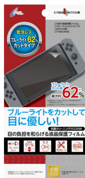
CYBER・液晶保護フィルム [ブルーライトカットタイプ] (SWITCH用)