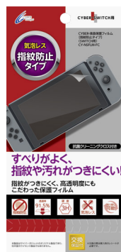
CYBER・液晶保護フィルム [指紋防止タイプ] (SWITCH用)