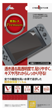
CYBER・液晶保護フィルム Premium (SWITCH用)