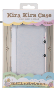
おひめさまクリア

軽くて丈夫なポリカーボネート素材のケースに、カラフルなラメが散りばめられています。