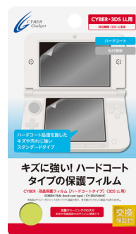
CYBER・液晶保護フィルム [ハードコートタイプ] (3DS LL用)