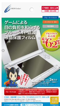
CYBER・液晶保護フィルム [ブルーライト62%カット タイプ] (3DS LL用)