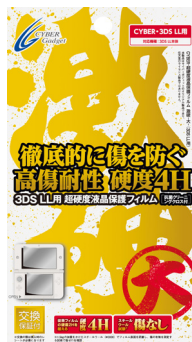
CYBER・超硬度液晶保護 フィルム・激硬・大 - (3DS LL用)