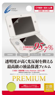
CYBER・液晶保護フィルム Premium (3DS LL用)

New 3DS LL用液晶保護フィルムとして、サイバーガジェット製の各種3DS LL用液晶保護フィルムがご使用いただけます。高透明度、指紋防止、キズ修復、ブルーライトカット、抗菌、高キズ耐性、耐衝撃など、さまざまな機能がついた下記3DS LL用フィルムはいずれも好評発売中です。