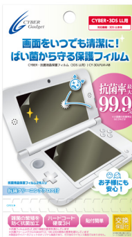
CYBER・抗菌液晶保護 フィルム (3DS LL用)