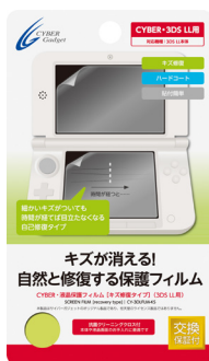
CYBER・液晶保護フィルム [キズ修復タイプ] (3DS LL用)