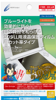
CYBER・液晶保護フィルム [ブルーライト99%カット タイプ] (3DS LL用)