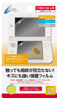
CYBER・液晶保護フィルム [指紋防止タイプ] (3DS LL用)