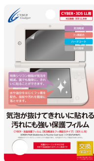
CYBER・液晶保護フィルム [気泡軽減&フッ素配合 タイプ] (3DS LL用)