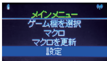
『アーケードフリーク』本体の液晶画面

液晶画面では他にも、接続するゲーム機の変更、現在のボタン配置の確認、Wi-Fi設定、言語設定など、様々な操作が可能です。