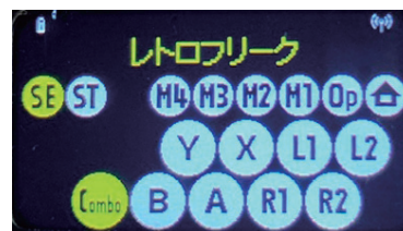
液晶画面のボタン配置表示