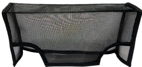
製品イメージ画像(裏面)