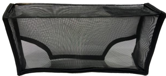
製品イメージ画像(表面)

このたび弊社では、Switch2向けゲームアクセサリとして、『 CYBER・ホコリ防止カバー (Switch2ドック用) 』を 2026年5月下旬 に発売いたします。